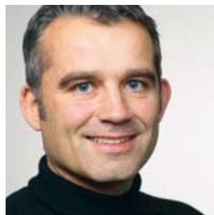
Beat Jans, Nationalrat SP Basel-Stadt

Wir Staatsbürgerinnen und -bürger erfüllen viele Pflichten: Wir zahlen Steuern und Gebühren, befolgen Gesetze und Regeln, begleiten unsere Kinder in ihrer Schulpflicht. Aber rund ein Drittel der Menschen, die diese Pflichten erfüllen, haben nicht die gleichen Rechte. Das Stimmrecht besitzen nur Schweizerinnen und Schweizer. An den wichtigsten Entscheidungen über unsere Zukunft sind nur sie beteiligt. Lasst uns diese Verantwortung teilen. Wenn Ausländerinnen und Ausländer, die ihren Lebensmittelpunkt hier haben, stimmen dürfen, dann gewinnt unsere Demokratie an Glaubwürdigkeit.