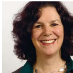
Anita Lachenmeier, Nationalrätin Grüne/Grünes Bündnis

Das Stimmrecht für Personen ohne Schweizerpass ist bereits vielerorts Teil der politischen Kultur der Schweiz. In den Kantonen Neuenburg und Jura existiert es seit langem, auf gemeindeebene auch in den Kantonen Genf, Waadt und Freiburg. Selbst in den Appenzeller Gemeinden Wald und Speicher können Ausländerinnen und Ausländer abstimmen und wählen. Die teils langjährigen Erfahrungen mit dem Ausländerstimmrecht sind durchwegs positiv. Wer über demokratische Mitwirkungsrechte verfügt, übernimmt auch Verantwortung für das Gemeinwesen. Packen wir diese Chance auch in Basel!